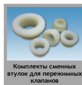
Комплекты сменных втулок для пережимных клапанов

Предоставленная выше информация не налагает на производителя никаких обязательств. Все права на внесение изменений без предварительного уведомления защищены.