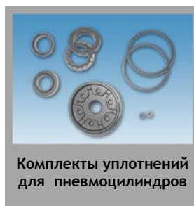
Комплекты уплотнений для пневмоцилиндров