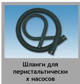
Шланги для перистальтических насосов

Запасные части для клапанов и насосов Flowrox: